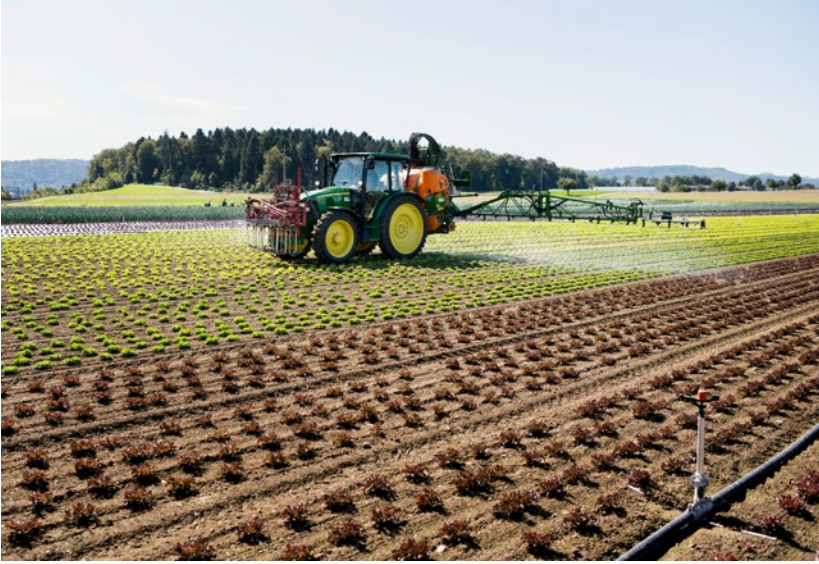
Les deux initiatives en cours visent en particulier l'agriculture et son utilisation de pesticides. L'Union suisse des paysans réplique que sans pesticides, la production agricole chuterait de près de 30 %.

abaisser les résidus de chlorothalonil au seuil autorisé. Il est possible de le faire par exemple en diluant l'eau, c'est-à-dire en lui ajoutant de l'eau non polluée. Un réseau de distribution d'eau du Seeland bernois entend éliminer les résidus par l'utilisation d'un nouveau filtre. D'après Martin Würsten, cela ne résout que partiellement ce grave problème. Car on s'écarte ainsi du principe qui veut que les eaux souterraines, en Suisse, ne doivent pas être traitées à grands frais.