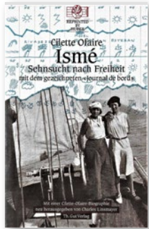
CILETTE OFAIRE «L'Ismé» Éditions de l'Aire, Vevey, 2020 549 pages, 39.00 CHF

En septembre 1933, le bateau à vapeur Ismé prend le large à La Rochelle, sur la côte atlantique française. Sa capitaine est Cilette Ofaire, la première femme suisse à exercer officiellement ce métier. Avec quelques matelots, dont l'Italien Ettore, elle a l'intention de contourner l'Espagne et le Portugal. Les mois d'hiver tempétueux, les employés portuaires corrompus ou les problèmes financiers obligent l'équipage à s'arrêter dans des ports, parfois pendant plusieurs semaines, avant de pouvoir gagner la Méditerranée à l'été 1934 par le détroit de Gibraltar. La capitaine subvient à ses besoins en écrivant des récits et en accueillant des passagers à bord contre paiement. Lors du