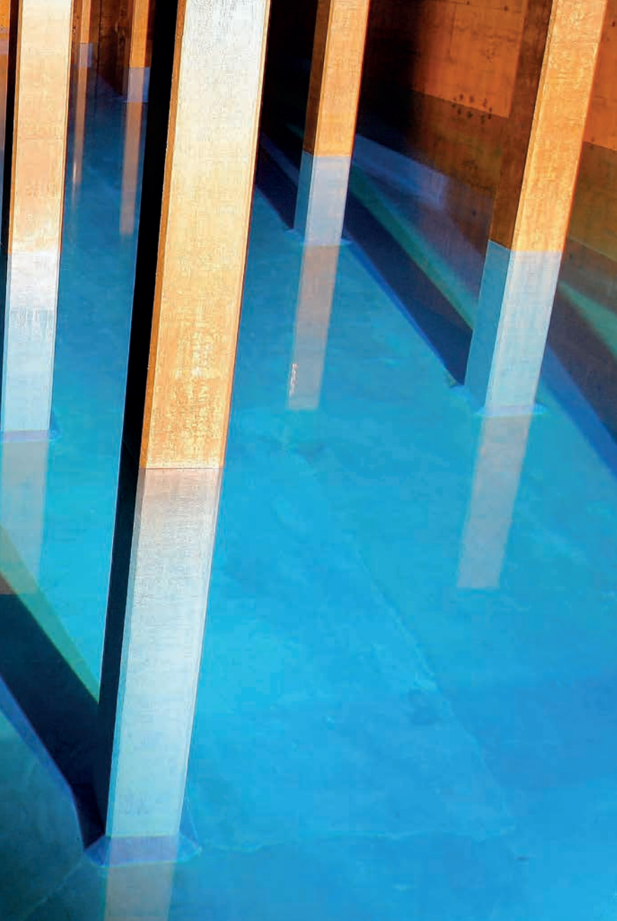
Le réservoir d'eau potable Lyren, à Zurich-Altstetten, ressemble à un temple souterrain enveloppé de bleu.