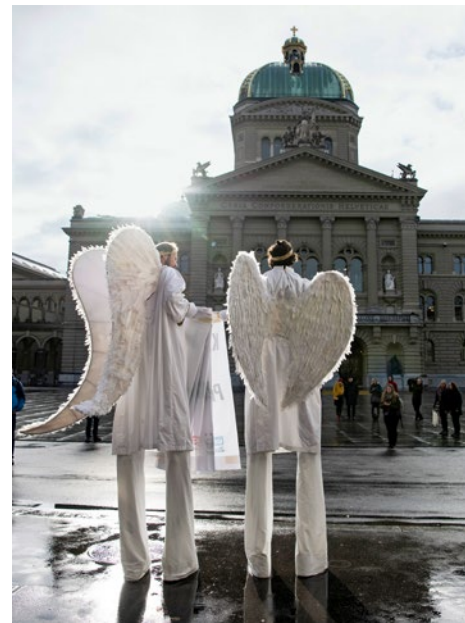
Deux «anges gardiens du climat» réclament une taxe climatique sur les billets d'avion devant le Palais fédéral. Si le peuple accepte la loi sur le CO 2, ce sera l'une des mesures mises en œuvre.

Les premières étapes sur la voie de la neutralité carbone de la Suisse se trouvent dans la loi sur le CO 2 que le Parlement a approuvée l'automne dernier. «Nous préparons le terrain pour que la Suisse puisse atteindre le zéro émission nette», souligne la ministre de l'environnement et de l'énergie, Simonetta Sommaruga (PS). Concrètement, la loi abaisse notamment les valeurs limites de CO 2 pour les véhicules et augmente les taxes sur l'essence et le mazout. Elle prévoit aussi une taxe CO 2 sur les billets d'avion. Ces mesures incitatives déplaisent en parti-