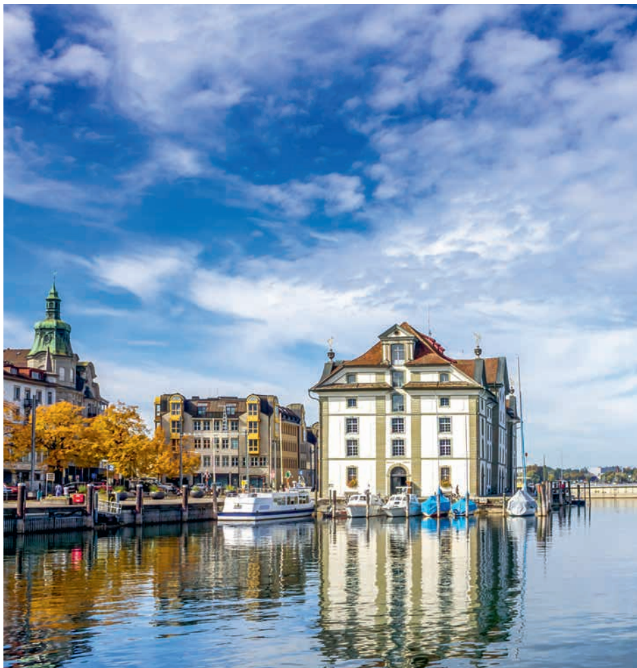
Das Kornhaus aus dem Jahr 1749

Da ich nun also auch in dieser Ausgabe nicht über eine unserer Veranstaltungen berichten kann, gebe ich Ihnen gerne wieder einen Tipp für einen schönen Ausflug mit auf den Weg. Wann waren Sie das letzte Mal am wunderschönen Bodensee? So praktisch in der Nähe gelegen, bieten viele Gemeinden am See wunderschöne Möglichkeiten zu Spaziergängen und Ausflügen. Ich habe einen Ausflug nach Rorschach unternommen und bin (wie immer) mit meinem Hund spazieren gegangen. Ich bin der Meinung, dass man besonders bei schönem Wetter am Wasser grossartig Energie tanken und die Seele baumeln lassen kann. Derzeit bieten auch dort viele Restaurants einen Take-Away-Service an. Unter Einhaltung aller Sicherheitsmassnahmen kann man sich z.B. eine feine Pizza holen und gemütlich am See geniessen.