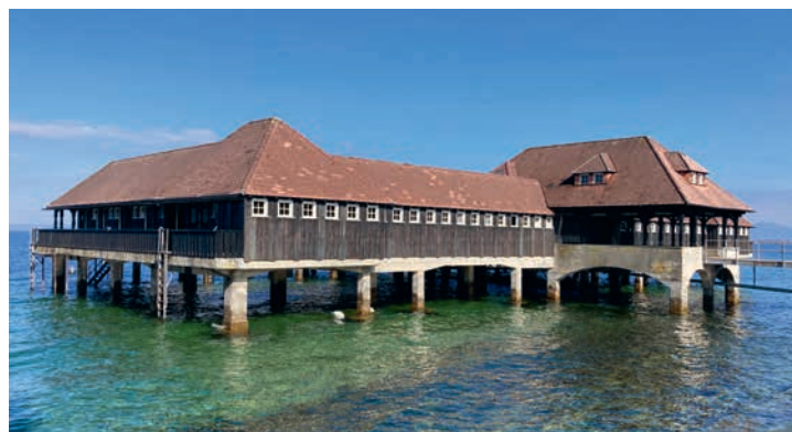
Die «Badhütte» aus dem Jahre 1924