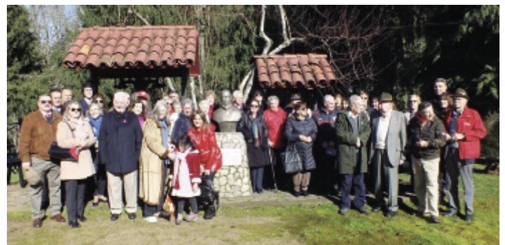
Fiesta Nacional Suiza en Traiguén