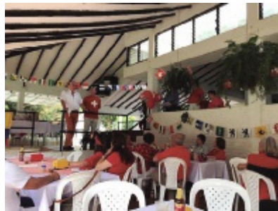
Celebración en Cali