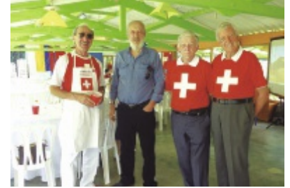
Celebración en Medellín