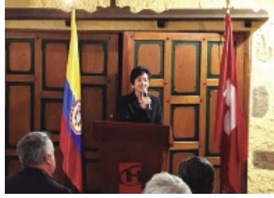
Celebración en el Club suizo de Bogotá

(ANA MARÍA BAUTISTA-EMBAJADA DE SUIZA EN COLOMBIA)