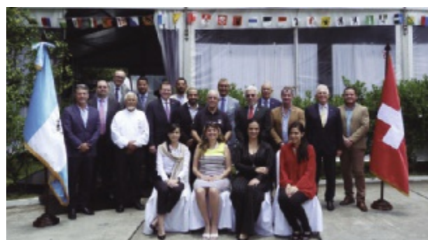
I Feria Comercial Suizo-Guatemalteca