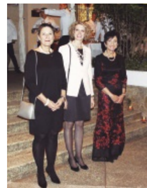
La Embajadora de Suiza en Colombia, Yvonne Baumann

Nacional Suiza en Colombia reunieron a miembros de la comunidad suiza en distintas ciudades del país, en eventos para reunirse en familia y compartir el orgullo de ser suizos.