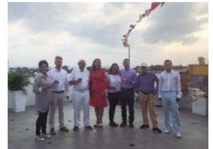
Fiesta nacional en Cartagena