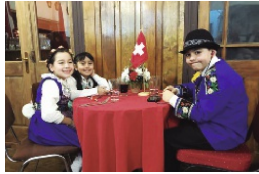
Los más pequeños de la fiesta con trajes típicos

(ALEX DUFÉY-PRESIDENTE CLUB SUIZO DE TRAIQUÉN)