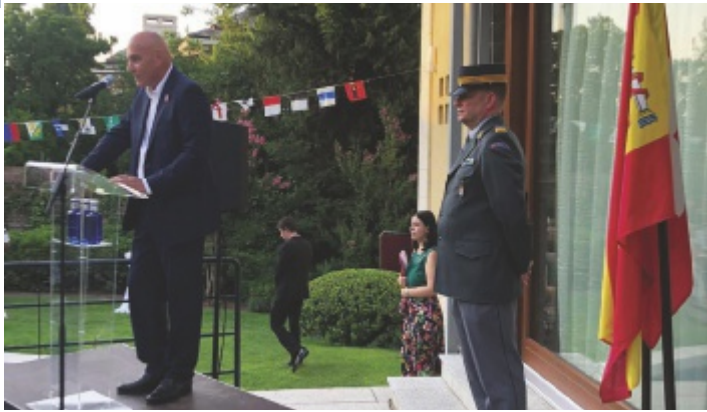
Botschafter Haas während seiner Rede... - L'Ambassadeur Haas lors de son discours...

Es ist schon Tradition, dass der Schweizer Botschafter für Spanien und Andorra zur 1. August-Feier in seine Residenz einlädt. Auch die-