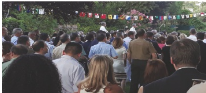
... welche von den Anwesenden mit Aufmerksamkeit verfolgt wurde. - ... qui a été suivi avec attention par les personnes présentes.