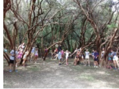
Taller sobre Suiza