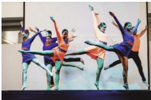
Grupo de danzas contemporáneas

La exposición "Arte y Derechos Humanos" fue una iniciativa de la Cooperación Suiza en Ni-