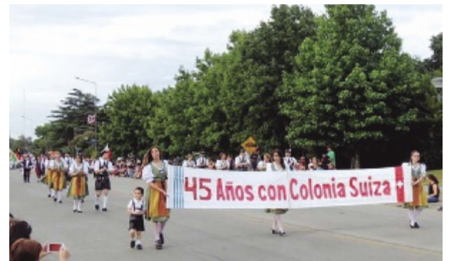
Los Alegres Alpinos en el desfile de la Bierfest 2018

El Municipio de Nueva Helvecia otorgó la Declaración de Interés Municipal a la celebración del 45º Aniversario de la creación del Grupo de Danzas Folclóricas "Los Alegres Alpinos".