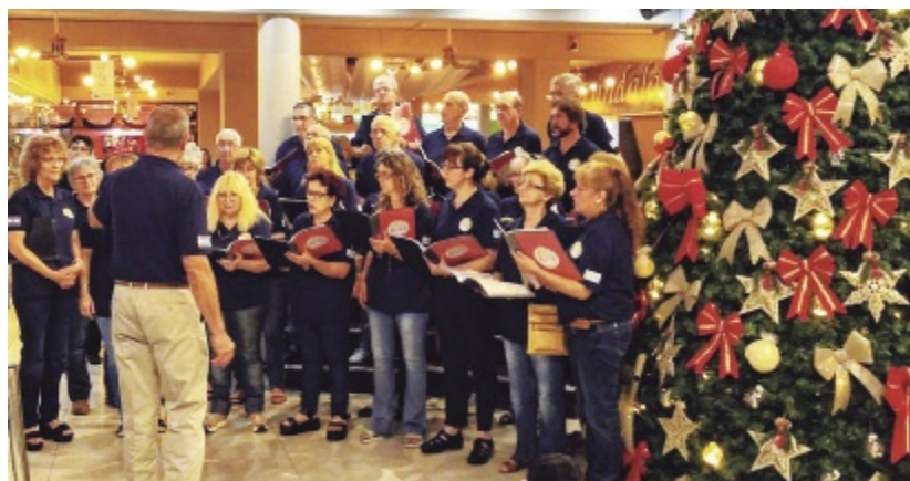
Coro Suizo de Paysandú