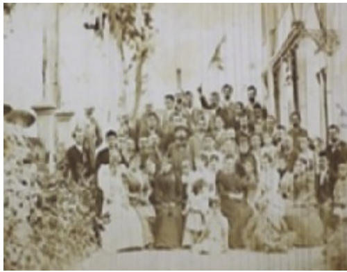
Die Schweizer Gemeinschaft in Portugal anlässlich der Bundesfeier vom 1. August 1892. La communauté suisse du Portugal lors de la commémoration du 1er août 1892.

De 1946 à 2017, un grand nombre d'entreprises suisses s'installent au Portugal. Notre communauté augmente et les membres de notre Société aussi. De leur côté, les demandes d'aide diminuent. La fortune de la Société est en forte progression, principalement grâce aux dons des entreprises suisses. Elle se concentre sur la gestion de sa fortune et initie une activité « d'institut financier » de la communauté suisse du Portugal. En 1963, la Société Suisse de Lisbonne (Club Suisse), grâce aux dons de la famille Sandoz et de membres de notre communauté, fait l'acquisition de l'actuelle maison suisse de Lisbonne. A cette occasion notre Société lui accorde un prêt pour mener à bien les travaux de transformation nécessaires. En 1985, elle prête au Club Suisse de Porto la somme nécessaire à l'acquisition