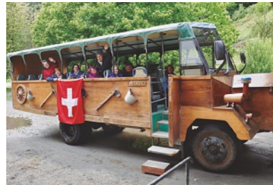
Recorrido del valle del río Peulla

El grupo caminó hacia una gran cascada y al día siguiente recorrimos parte del valle del río Peulla, en un camión transformado en bus. Todos fuimos capturados por la exquisita miel que otro suizo produce con la gran variedad de flores nativas del bosque, parte de un Parque Nacional. No fue po-