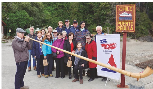
Integrantes del Club Suizo de Osorno