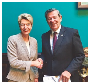
Senadora Karin Keller-Sutter y Canciller Uruguayo Rodolfo Nin Novoa

Si tiene problemas para acceder o si tiene preguntas sobre la ventanilla en línea del DFAE, dirijase por favor al Centro Consular Regional Buenos Aires.