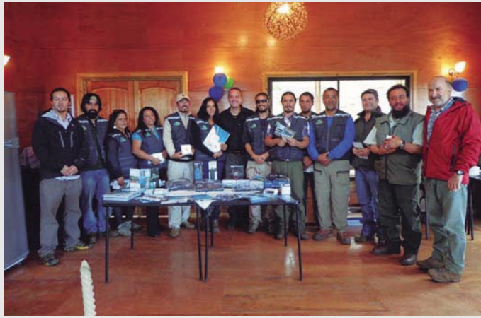
Entrega del equipamiento a los Guías de Turismo Acreditados