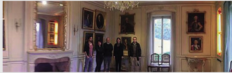
Personal que trabaja en el museo

1 Swissinfo, Marcela Águila Rubín-Ginebra 2 Panorama Suizo N°1/2014 3 Swissinfo, Marcela Águila Rubín-Ginebra (AMADA DOMÍNGUEZ DE SCHOCH)