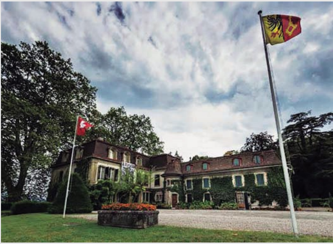
Chateau de Penthes

un imperio industrial en España a comienzos del siglo pasado. La calle en donde está ubicado "Chemin de l'Impératrice" debe su nombre a que en un lugar cercano vivió una temporada la Emperatriz Josephine de Beauharnais después de su divorcio de Napoleón Bonaparte.