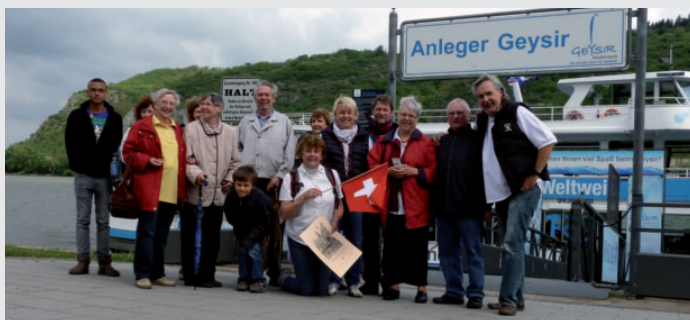
Ankunft auf dem Namedyer Werth, einer Insel im Rhein