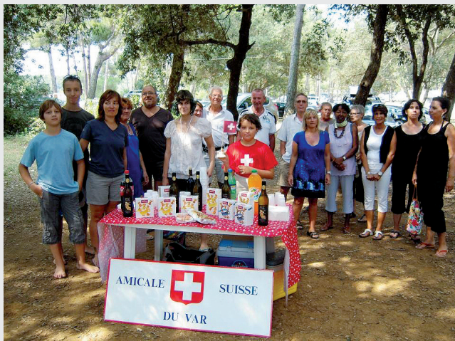
Une partie des convives du pique-nique du mois de septembre.