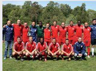
17 juin 2012: les Suisses de Paris vainqueurs de la Coupe des Hauts-de-Seine.

Résultat étonnant pour notre première participation au Forum des Sports du 15 ème arrondissement de Paris le 15 septembre dernier : pas moins de 10 nouveaux joueurs français et étrangers (Canada, Italie et... Suisse) ont manifesté leur intention de rejoindre notre club. Le passage à notre stand du Député-Maire Phi-