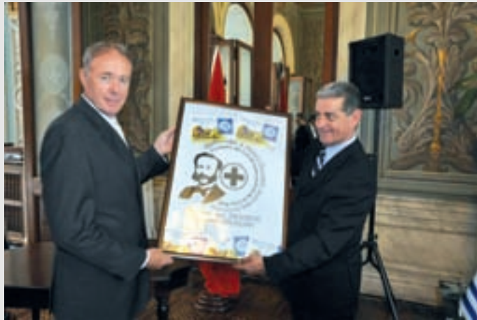
Homenaje a Henry Dunant-Presentación matasello