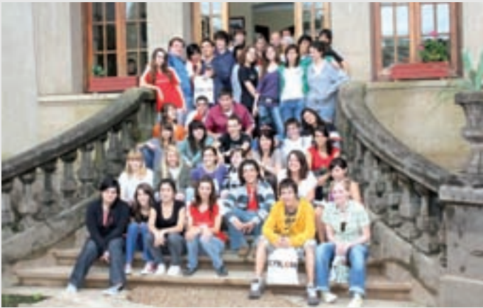
Estudiantes y docentes del intercambio, frente a la Oficina de Turismo en Colón, Entre Ríos-Argentina

vin, profesora de francés de la Escuela Normal Superior "República Oriental del Uruguay", residente en la ciudad de Colón-Provincia de Entre Ríos- cuyos ascendientes de apellidos Bonvin, Delasoie, Favre son precisamente del Cantón de Valais. Su respuesta fue rápida: "Ésta es una oportunidad formidable que yo esperaba desde hacía muchos años, me alegró esta propuesta en beneficio de mis alumnos y me puse a trabajar para hacerla realidad."