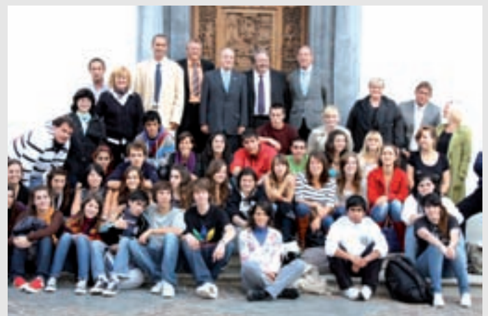
En Suiza, colonenses y valesanos. En el centro, el Embajador de Argentina en Suiza