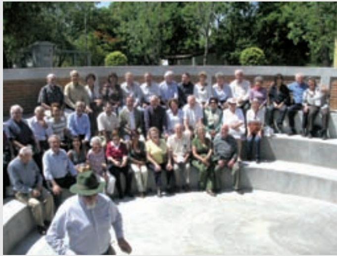
Grupo "60 Plus"

Como siempre fue un agradable paseo en el que volvimos a encontrarnos los integrantes de